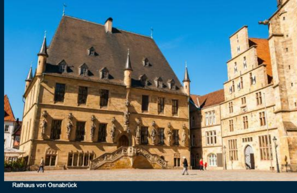
Rathaus von Osnabrück

Osnabrück lebt als Friedensstadt den Leitgedanken „Frieden als Aufgabe – dem Frieden verpflichtet“, und ist stolz auf ihre gelebte Vielfalt – Zugewanderte sind seit Jahrzehnten Teil der Bürgerschaft. Anhaltend hohe Wanderungsintensitäten, eine wachsende diverse Gesellschaft aber auch rezente Fluchtbewegungen erfordern jedoch ein neues Denken im Sinne eines ganzheitlichen Integrationsmanagements bei dem Stadtrat, Stadtverwaltung, Bürgergesellschaft und Institutionen eng zusammenarbeiten.