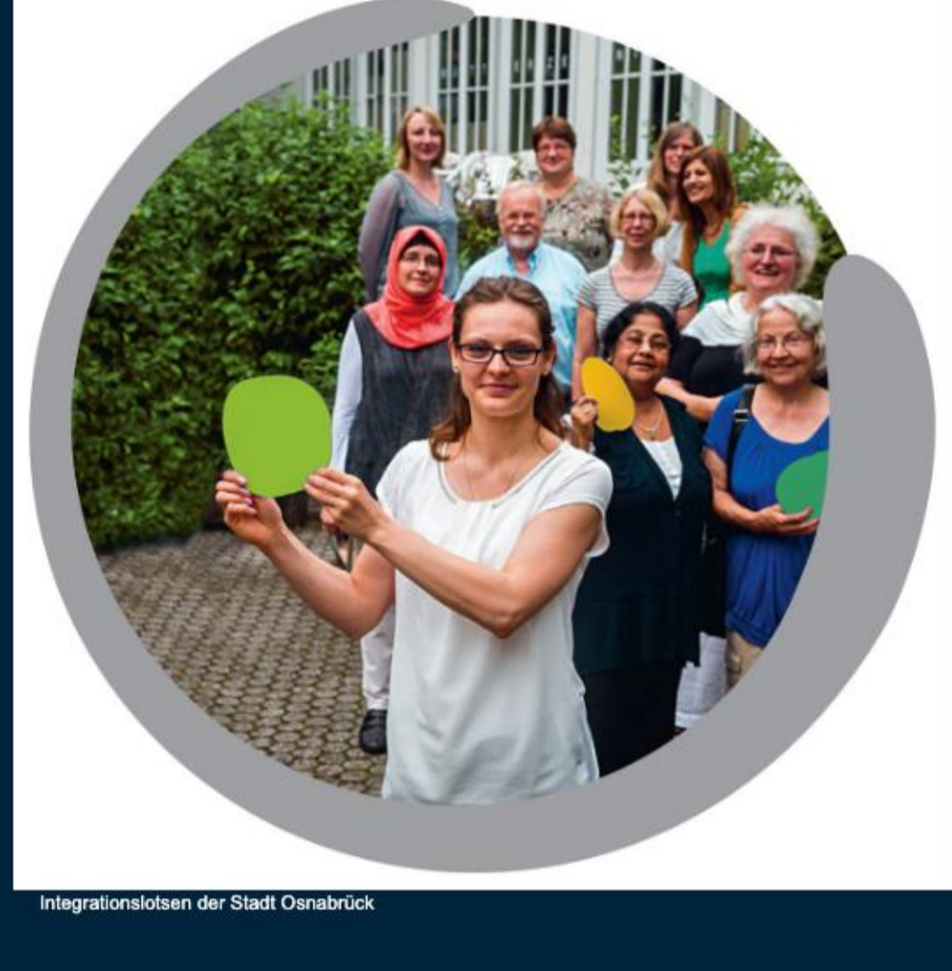
Integrationskassen der Stadt Osnabrück